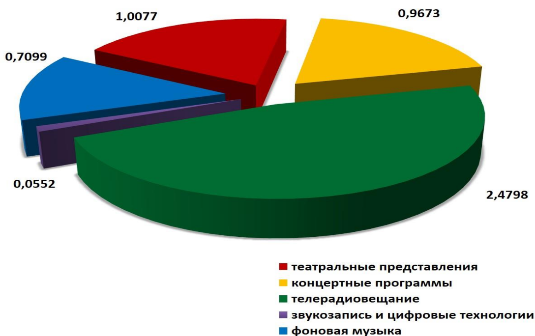
Рис. 2. Структура собранного в 2017 году вознаграждения по секторам использования (млн. руб.)

Распределение поступающего вознаграждения осуществлялось в соответствии с Инструкцией о порядке распределения вознаграждения, собранного в ходе ведения коллективного управления имущественными правами, утвержденной приказом генерального директора НЦИС от 30.06.2010 № 79 в редакции, утвержденной приказом генерального директора НЦИС от 28.06.2016 № 45 (доступна для ознакомления на сайте НЦИС по ссылке: http://belgospatent.by/russian/docs/instr28_06_2016.pdf ).